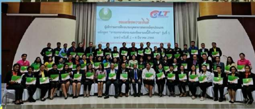
อบรมหลักสูตรการเจรจาต่อรองและติดตามหนี้ค้างชำระ ณ สันนิบาตสหกรณ์แห่งประเทศไทย