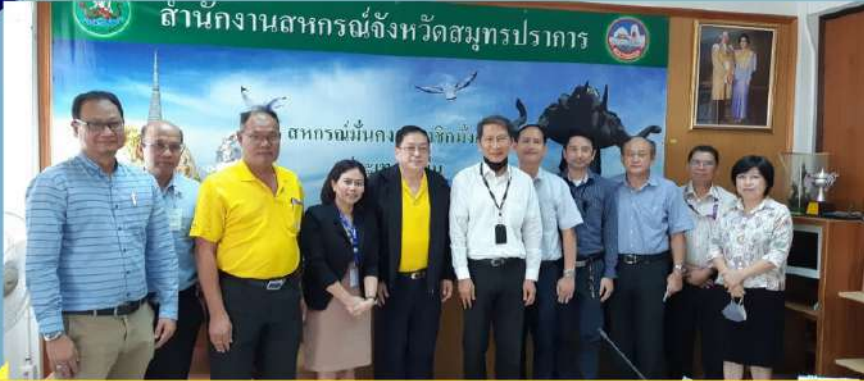
ปรึกษาหารือร่วมกับสำนักงานสหกรณ์จังหวัดสมุทรปราการ