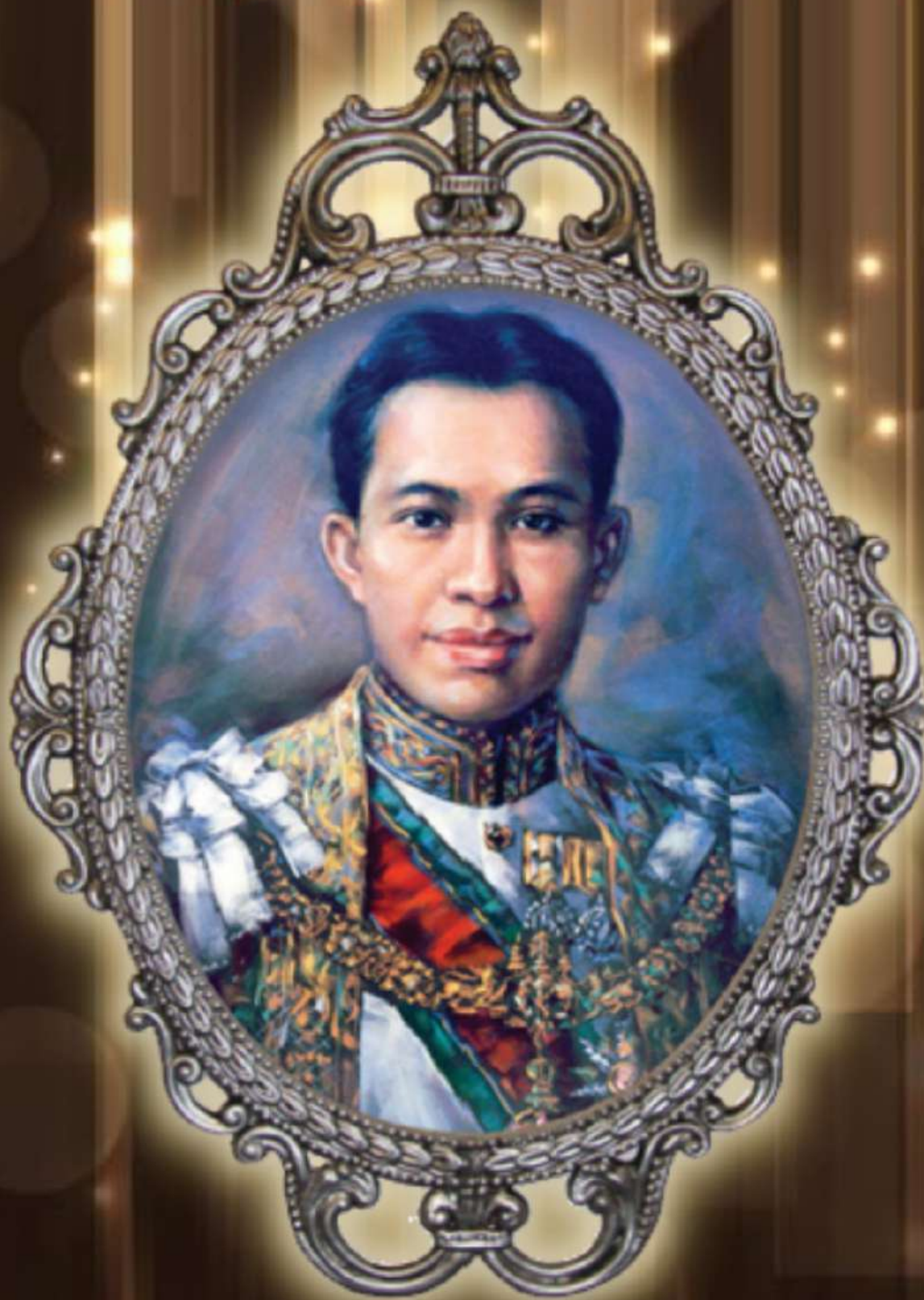
พระราชวังคีรีดง กรมหมื่นพิทยาลงกรณ์ พระบิดาแห่งการสหกรณ์ไทย