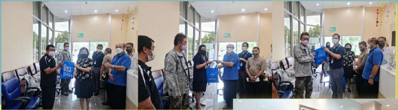
จำหน่ายครุภัณฑ์สหกรณ์ประจำปี 2563