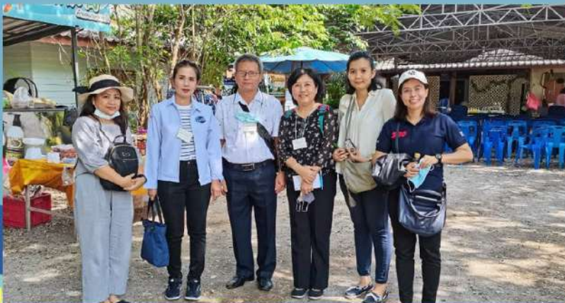
โครงการสัมมนาเพื่อเสริมสร้างประสิทธิภาพในการบริหารจัดการสหกรณ์ออมทรัพย์ในสถานประกอบการ จังหวัดสมุทรสงคราม